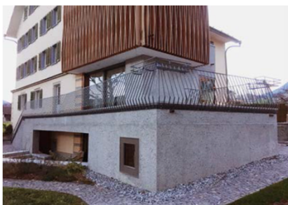
Umbau Wohnhaus Schwyz, Reichlin Bau AG, Ibach